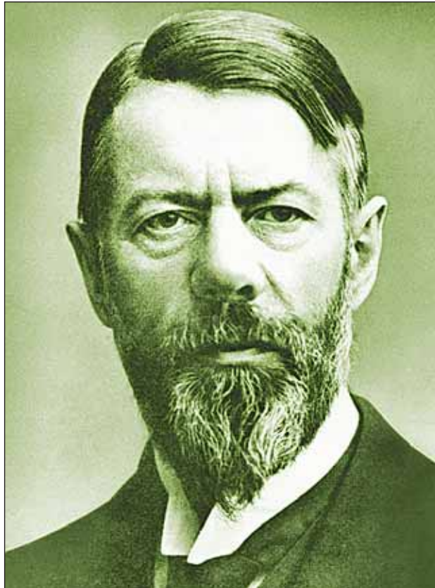
Max Weber (1864-1920)

Lo dicho; para los que entendemos la democracia como otra cosa (esa vida libre y apacible) y denostamos el capitalismo, de momento es perseguir horizontes...