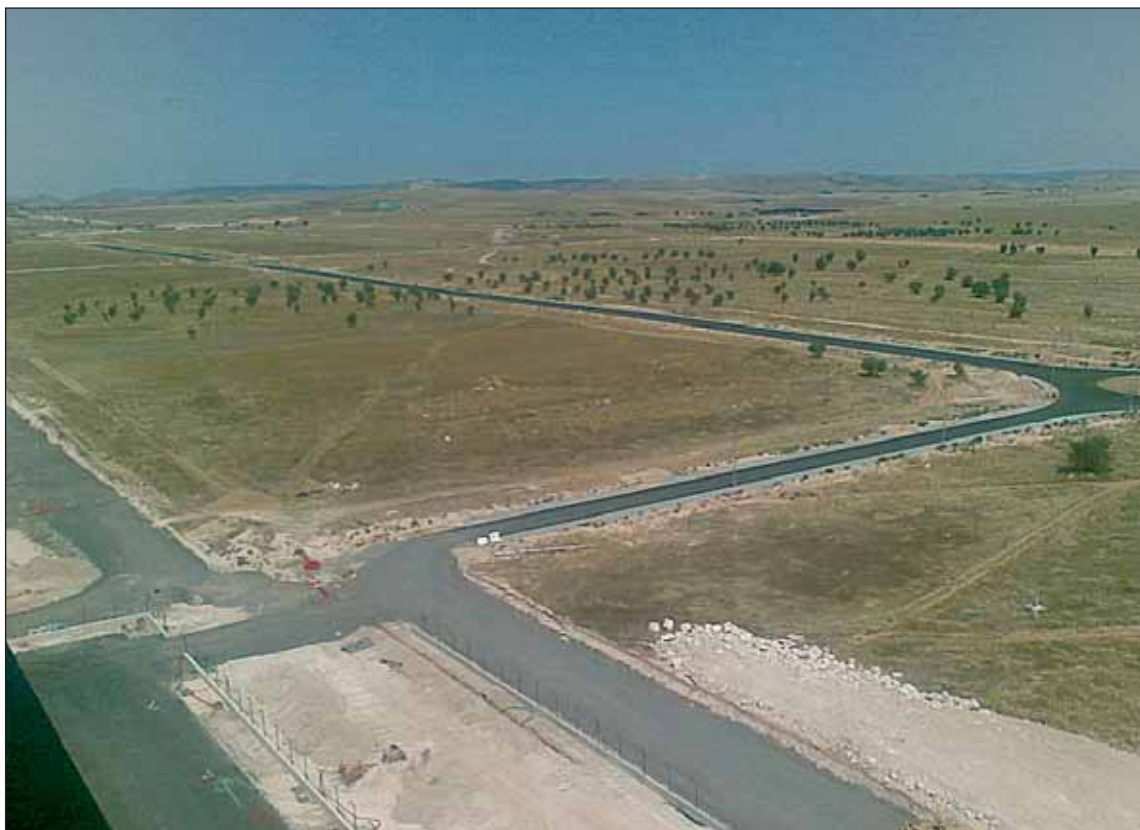
El “aeropuerto” de Ciudad Real, una de las joyas del Régimen cleptómano

PP y PSOE se alternan en el poder central, incapaces de pensar más allá de los votos que cosecharán en las próximas elecciones, presos de la seducción de la marca Comunidad Autónoma, donde los partidos se disputan su futuro y el de los suyos. “La política es el arte de buscar problemas, encontrarlos, hacer un diagnóstico falso y aplicar después los remedios equivocados”. Lo dijo Groucho Marx , y nuestro sistema político parece haberse adecuado para que la máxima se cumpla a rajatabla.