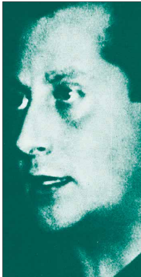
José Antonio Primo de Rivera

España creyó que había llegado su revolución el 13 de septiembre de 1923, y por eso estuvo al lado del general Primo de Rivera. Por inasistencias y equívocos se ma-