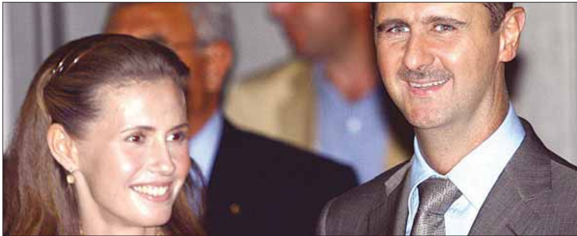
De oca a oca y disparo porque me toca: acabar con el matrimonio Al-Asad... para después atacar Irán

que obliguen a una fuerte represión por parte del Estado objeto de la agresión, que se siente en peligro.