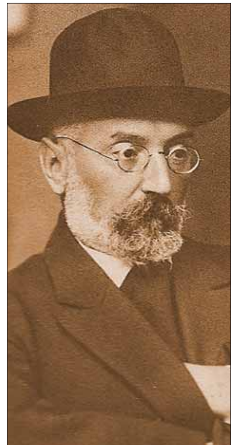
Miguel de Unamuno

Nuestro movimiento juvenil falangista cala hondo en el hombre de hoy y en su problemática general. La liberación del hombre y su plena realización como persona —dimensión individual y dimensión social— son nuestra razón primera y nuestro fin último. Rompemos con los esquemas imperantes del humanismo horizontal, que