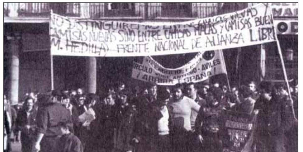
Los hedillistas del Frente Nacional de Alianza Libre (FNAL) se manifiestan a principios de los años 70

calista revolucionaria, las aportaciones van de abajo hacia arriba, a una capitalización nacional. Imaginemos que se crea en la cúpula un Consejo económico y social, debidamente asesorado por especialistas, y que ese capital, entendido como maquinaria y dinero, se reparte entre los consejos económicos y sociales que se distribuyen regionalmente, según el principio de subsidiariedad. Los municipios y comunas, agrupados libremente, democráticamente según confederaciones libres que pueden reanimar las comarcas como órganos vivos de representación y convivencia, acuden a ese Consejo, que ellos han elegido democráticamente entre sus componentes, para solicitar crédito y maquinaria para el proyecto en el que han trabajado, previa consulta con las ayudas y orientaciones del elemento profesional y especialista contratado por estos Consejos Regionales.