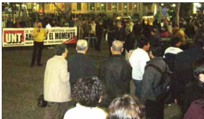
Un momento de la concentración organizada por UNT

Los afiliados que esperaban en Callao se fueron enterando de la modificación del lugar y se fueron acercando a la Puerta del Sol, si bien varios grupos de personas que acudieron a Callao, se fueron pensando en que se había des-