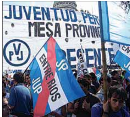
Manifestación de jóvenes peronistas

Hoy existen dos tendencias en el peronismo: El oficialismo o kirchnerismo ( Néstor Kirchner el último presidente del Partido Justicialista) y un frente per-