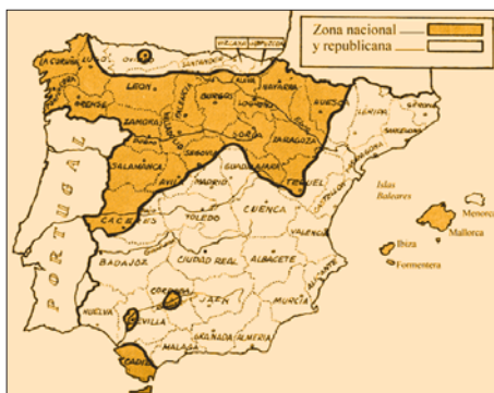
La provincia de Badajoz en relación con el territorio controlado por ambos bandos al comenzar la Guerra Civil

La pasividad de las fuerzas armadas y la ausencia de elementos civiles eficazmente coordinados, serían decisivas a la hora de inclinar definitivamente a favor de la República la capital pacense. Lo ocurrido aquí iba a arrastrar al resto de la provincia aunque no por ello faltaron algunos núcleos sublevados, de los cuales únicamente podía tener alguna posibilidad de imponerse el que se formó en las localidades de Castuera y Villanueva de la Serena. Pero en la inmensa mayoría de los