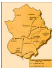
Principales operaciones militares en Extremadura durante la Guerra Civil