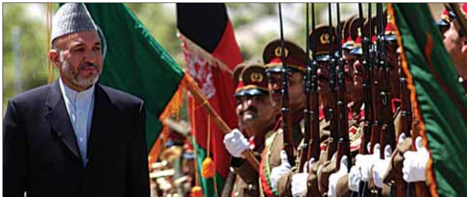
Hamid Karzai, el hombre fuerte de Kabul impuesto por los norteamericanos, pasando revista a un destacamento militar

Todos sabemos —o deberíamos saber— que el hecho de que una mentira sea repetida mil veces no hace que se convierta automáticamente en verdad. Durante las últimas décadas, troyanos y troyanos —léase “populares” y “socialistas”— se han empeñado en presentarnos una serie de conflictos internacionales a la medida de sus tácticas y discursos partidistas, con un desconocimiento bastante acusado de los desarrollos y derivas de la geoestrategia mundial y, desde luego, todos —“populares” y “socialistas”— bailando la música que se toca desde Washington.