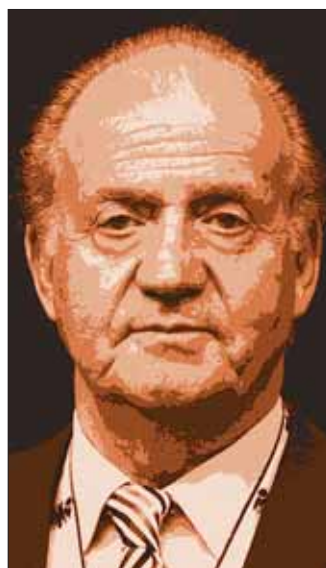
Juan Carlos I, rey por gracia de Franco Bahamonde

El monarca ha sido quien más ideales patrióticos ha cercenado eficazmente desde arriba, evitando así toda posibilidad de reacción de las fuerzas de unión frente a las fuerzas de disociación, todo ello bajo el deber constitucional de fidelidad al “jefe de las Fuerzas Armadas”. Aun siendo el paradigma del cero maurrasiano, goza de una total impunidad en el tratamiento informativo. La figura del jefe del Estado es tratada, por los medios periodísticos, con tal precaución y cuidado que parece que estén hablando de “El