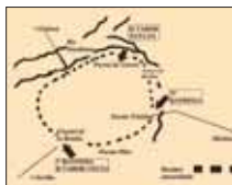
Ocupación de Badajoz

mujeres, una de ellas junto con sus dos hijos de seis meses y cuatro años. A media mañana los trasladaron a la sacristía de la iglesia parroquial y, hacia las tres de la tarde, los milicianos hicieron una descarga que incendió el templo previamente rociado de gasolina. Al ver entrar las llamas en esta dependencia, algunos presos consiguieron forzar las puertas de comunicación con el resto de la iglesia y se dividieron en dos grupos: unos subieron a una torrecilla con entrada desde el retablo mayor y que comunicaba con el tejado, y otros se refugiaron en un cuartoito donde se defendían de la asfixia echándose aire con las pastas de algunos libros que allí se encontraban. Los que no lograron salir de la sacristía, se asomaban a las ventanas y recibían descargas. Como balance final quedaron doce muertos y nueve heridos de gravedad, los restantes sufrieron síntomas de asfixia y el padre de los dos niños, perdió la razón. Además, se incendió el Juzgado, la Notaría, el Registro de la Propiedad, un convento y otros edificios.