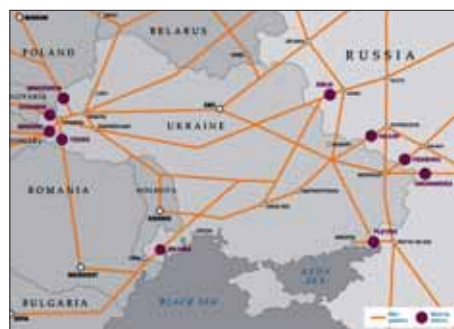
Las rutas del gas ruso hacia Europa occidental

Para comprender la importancia del gas en Europa Central y del Este, hay que saber que éste, en invierno (con temperaturas medias en el exterior de —15 a —5 °C), lo es todo allí: energía, calefacción y cocina en todos los hogares, industrias y edificios públicos. Moscú sabe muy bien esto, y reforzada económicamente por el alza del gas y el petróleo en los últimos años (pro-