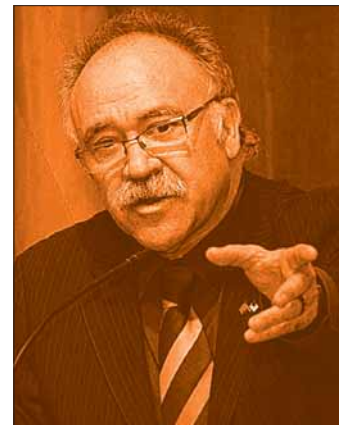
Carod-Rovira, apóstol del antiespañolismo

A estos separatistas no les arredra en lo absoluto dejar por el camino las posibilidades de promoción y de progreso de las jóvenes generaciones de españoles atrapadas en el sectarismo reduccionista de su estrategia, a las que privándolas del castellano las condenan a la servidumbre de un horizonte acotado en los límites del terruño.