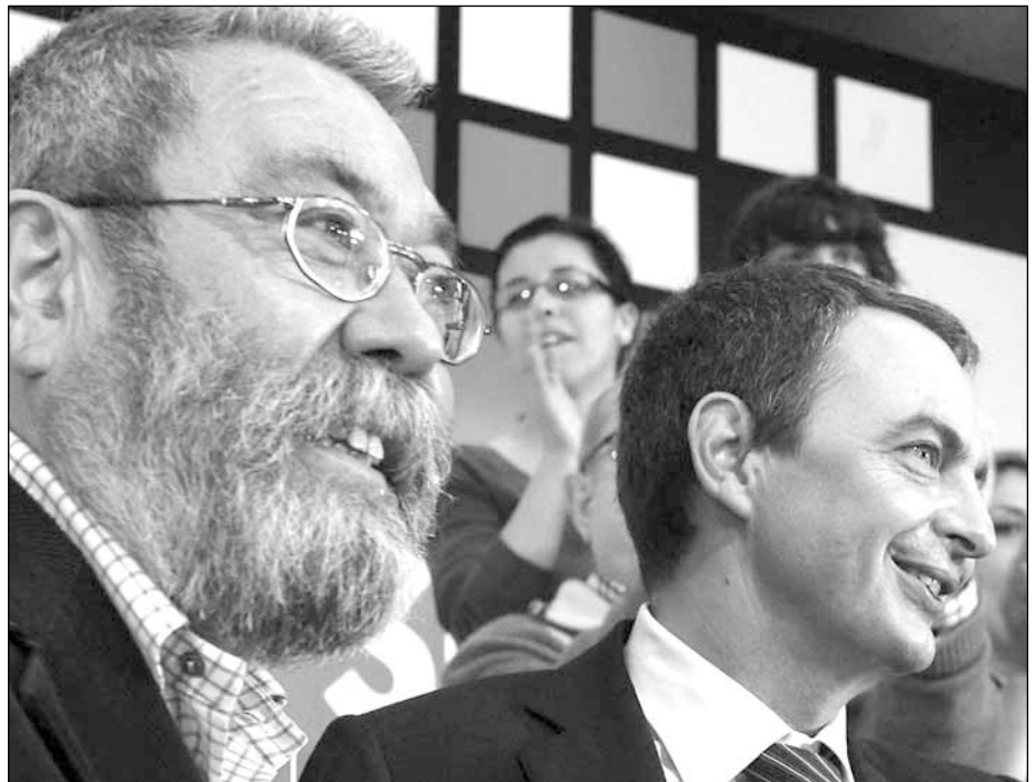
¿Líderes de y para la clase obrera?

Tampoco es mal negocio el de las pensiones de los funcionarios. Y aquí sí que se alían directamente con la banca, ya sin caretas, concretamente con el BBVA . El mecanismo, no por chabacano no deja de ser curioso: se crea una empresa: " Gestión de Previsión y Pensiones ", de la que forman parte de su accionariado junto con el BBVA (70% BBVA , 15% UGT y 15% CC.OO ) que fue elegida en un concurso