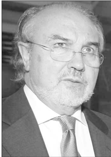
Pedro Solbes, un especialista en limpieza de... bolsillos ajenos.

La limpieza de la economía tenía que haberse acometido hace años, para evitar que España fuera feudo de especuladores y saltimbanquis del ladrillo, para garantizar la prosperidad de los españoles y españolas con