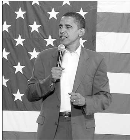
Barak Obama, la nueva faz de Yanquilandia.

Contrariamente a lo que opinan algunos ultras descerebrados, Obama no es el embajador de Belcebú llamado a convertir a los Estados Unidos a la fe de la bandera verde del Profeta. Antes de ser elegido por el voto de los ciudadanos norteamericanos, Obama ya había sido elegido por los banqueros, el complejo industrial-militar y los lobbys que, en realidad, controlan la primera potencia mundial. ¿Hubiera un agente de Bin Laden manejado más de 600 millones de dólares, dinero que ha laminado todos los récords en materia de financiación